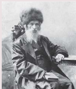
הגר"ר שלמה הכהן מווילנא זצ"ל

מדיבחה בגמ' (שבת קמז, ב) "כולהו שקייני מדיבחה ועד עצרתא מעלו" - כל עד עצרתא משקים של רפואה מועילים מפסח עד שבועות. החת"ס ביאר לפי זה הרמז אייר ראשי תיבות אני ה' רופאין שימי אייר הם לרפואה. אבל לולי דברי רש"י שמפרש 'מדיבחה' מפסח, היה אפשר לפרש כוונת הגמ' "כולהו שקייני מעלי מדיבחה עד עצרתא" בענין אחר. דהנה יש לדקדק על פירוש רש"י, שברוב מקומות קרוי הפסח 'פסחא' ולא 'דיבחה'. ועוד צע"ק דבגמ' קאמר לפני זה שיש כ"א ימים של רפואת דיומסת ועצרת מן המנין, ומוכיח הגמ' שעצרת הוא היום האחרון ממה שכולהו שקייני מעלי מדיבחה עד עצרתא, ש"מ עצרת לבסוף, ע"כ. ולכאורה קשה, א"כ מהיכי תיתי שיש כ"א ימים, ולמה אין אומרים שכמו שהמשקאות מועילים חמשים יום מפסח עד שבועות הוא הדין דיומסת. ועוד שנינו בגמ' פסחים (מב, ב) שזיתום המצרי שותים לרפואה מדיבחה עד עצרתא. ולכאורה תמוה, והרי בפסח אסור לשנותו משום שיש בו חמץ. והנראה בזה לפי הנ"ל, שכוונת 'דיבחה' על פסח שני, והגמ' קוראת אותו 'דיבחה' לחלק בין פסח ראשון לפסח שני. ובזה אתי שפיר שיש כ"א יום בדיוק מפסח שני עד עצרת.